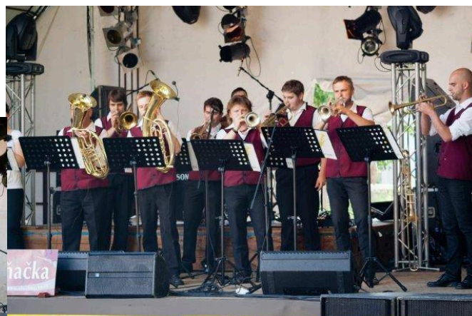
Choceňka THE OYSTERS, TAI-PAN, MODRÝ MAURICIUS

a hlavní hvězda, plzeňská skupina BURMA JONES.