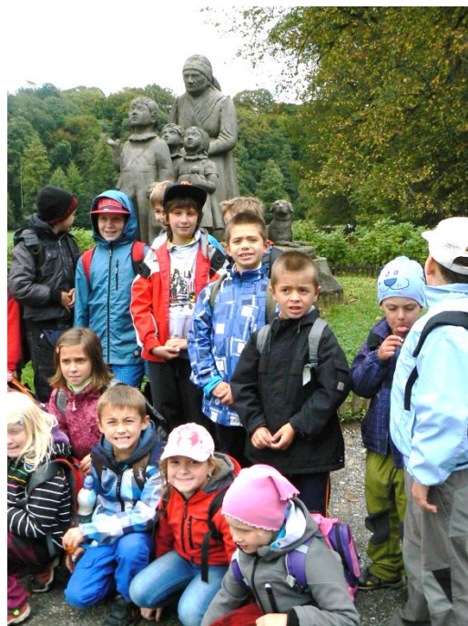
Z výletu z Ratibořic (září 2014) 1

Výborná spolupráce je navázána i s rodiči dětí, kteří malým i větším školákům umožnili nahlédnout, co dělají v zaměstnání (např. ukázka hasičské techniky). Příprava předškoláků pro vstup do základní školy je na velmi dobré úrovni. Děti pracují podle pracovních sešitů KuliFerda.