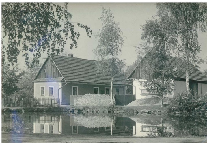
stavení č. 17