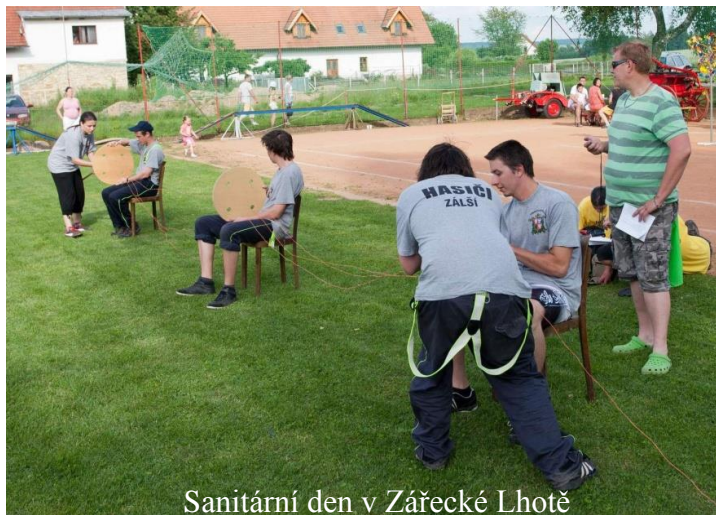
Sanitární den v Zářecké Lhotě

Tento rok proběhla i akce čistě hasičského charakteru. To když naproti bytovce, po silném větru, spadl přes silnici značně vzrostlý strom. Přes doslova okamžitou reakci a zastavování dopravy došlo, v důsledku hustého deště, ke střetu osobního automobilu se spadlým stromem. Nehoda se naštěstí obešla bez zranění. Po zprůjezdění části komunikace, spolupracoval náš sbor s PČR na řízení dopravy. Po zklidnění povětrnostních podmínek se ještě téhož večera podařilo zprůjezdit silnici v plném rozsahu.