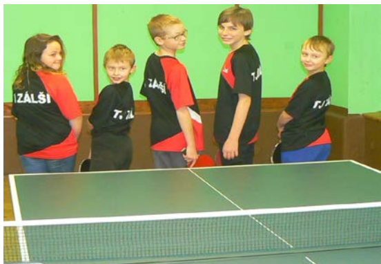
Naši žáci v oddílových dresech

Za úspěch považuji, že jsme v letošním roce z velké nabídky triček různého střihu, materiálu a barevného zpracování vybrali nové oddílové dresy.