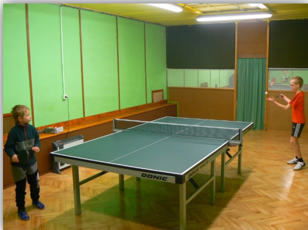
Hrají: Josef Peterka a Matěj Macák

V uplynulém roce se ze sportovního hlediska dařilo našemu družstvu mužů „A“, kterému se podařilo udržet v regionálním přeboru 1. třídy a také družstvu mužů „C“, které se celou sezónu pohybovalo na předních příčkách v nejnižší 5. třídě a po restrukturalizaci soutěže bojuje v letošní sezóně ve 4. třídě. Pouze družstvo mužů „B“ sestoupilo ze 2. třídy do třídy 3.